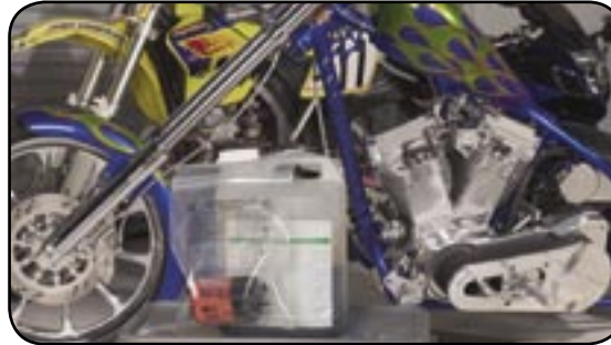
DMD custom chopper

Call your garbage company for a free used motor oil container and filter bag, or pick one up at any of the designated locations on the enclosed list.