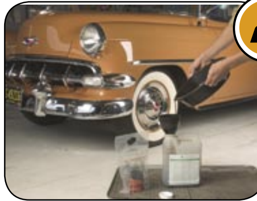
1954 Chevrolet Bel Air