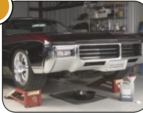
1969 Buick Riviera