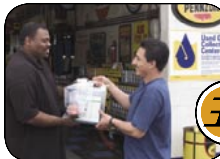
Mr. Lubrication, Seaside